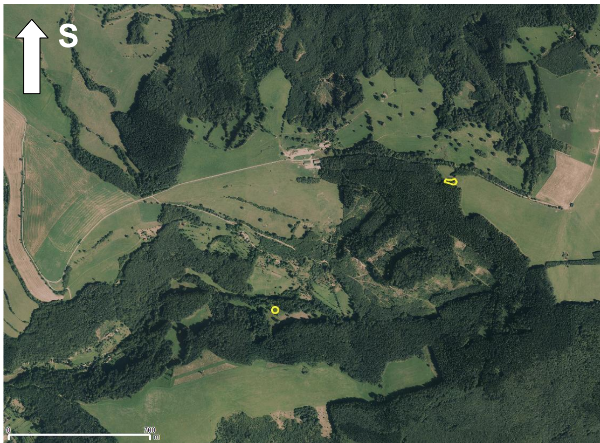
Bylnice, PP Hluboče (uprostřed) a severní svah vrchu Tratihušť (v pravém horním kvartálu).