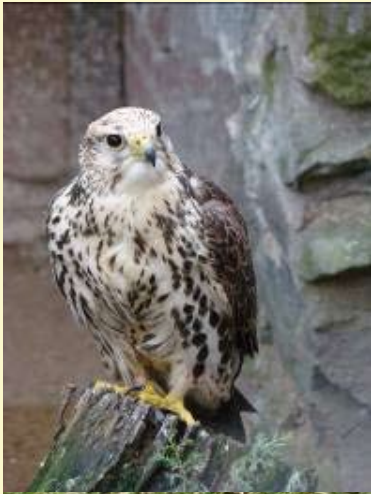
Raroh velký , na sysly specializovaný predátor, v ČR kriticky ohrožený druh

Pro prohlídku kontaktujte AOPK ČR na tel. 724918198.