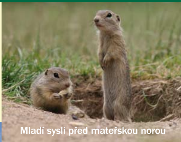
Mladí sysli před mateřskou norou

Sysel obecný je kriticky ohrožený hlodavec z čeledi veverkovitých ( Sciuridae ). V 50. letech 20. století byl považován za významného hospodářského škůdce a byl cíleně huben. Dnes je ohrožen především ztrátou vhodných biotopů. Je chráněn podle české i evropské legislativy.