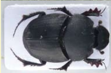
Lejnožrout Ontophagus vitulus , vývojem svých larev vázán na syslí trus

Pro MŽP zpracovala Agentura ochrany přírody a krajiny ČR (AOPK ČR)